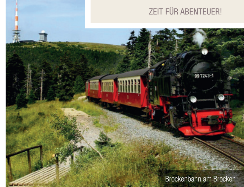
Brockenbahn am Brocken

Unser Resort ist der perfekte Ausgangspunkt für verschiedenste Entdeckungstouren quer durch den magischen Harz. Genießen Sie die traumhafte Natur, besuchen Sie idyllische Städtchen oder erleben Sie die atemberaubenden Highlights der Region. Im Harz ist für wirklich jeden etwas dabei – ganz egal ob Jung oder Alt. Viel Spaß!