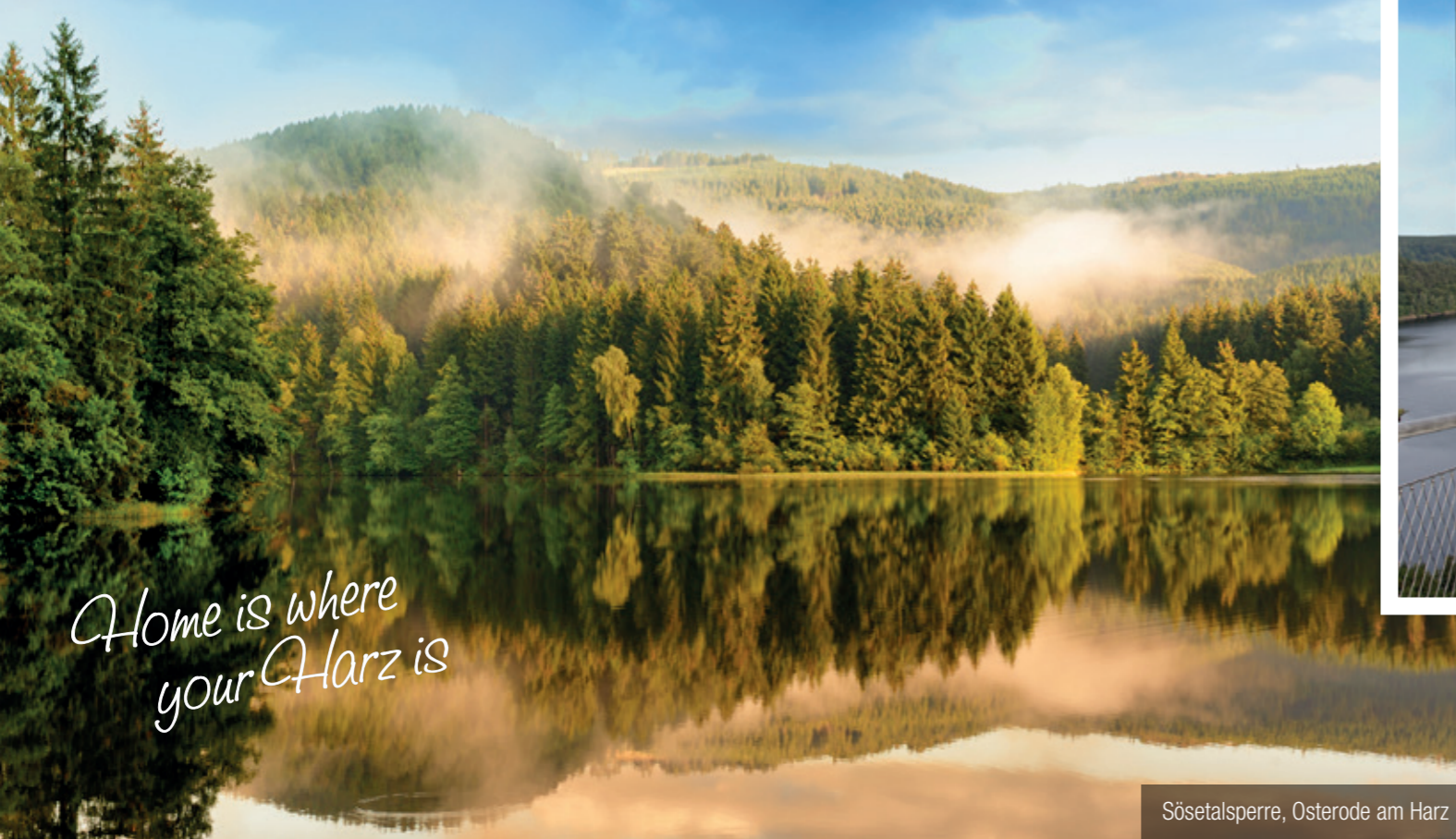
Sösetalsperre, Osterode am Harz