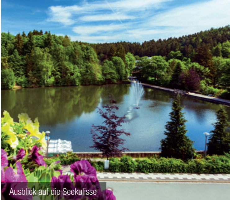
Ausblick auf die Seekulisse