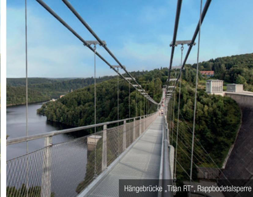
Hängebrücke „Titan RT“, Rappbodetalsperre